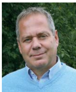
Stefan Einhorn.

Två torsdagar i vår inbjuder vi till öppna föreläsningkvällar med intressanta föreläsare.