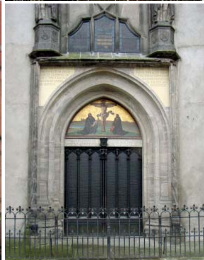
predikade nästan varje vecka i 32 år.