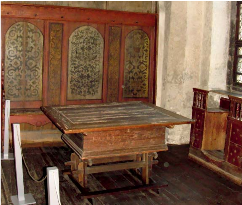
Matsalen i Luthers och Katharinas hem där bordssamtalen fördes.

skrifter skulle förstöras och vem som helst kunde ostraffat förgripa sig på honom. Han fick dock fri lejd från Worms och på resan därifrån blev han "kidnappad" av Fredrik den vises män, som placerade honom i skyddsarrest högt uppe på borgen Wartburg. Där satt han gömd – många trodde han var död – och skrev febrilt, framför allt översatte han Nya testamentet från grekiska till samtida folkspråk. Nu var det viktiga att Skriftens ord skulle kunna nå alla läskunniga. På den byggde ju Luthers tro och tänkande.