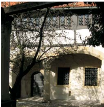
Huset där Luther föddes i Eisleben.

Dramatiken i Martin Luthers liv berodde mycket på det motstånd han mötte. Hans far, bergsmannen Hans Luder (senare ändrade Martin efternamnet till Luther), ville att Martin skulle bli jurist och hävdade att han bröt mot budet "Hedra din fader och din moder" när han i stället blev munk och präst. Kanske hade han lockats in i kloster av Djävulen. Och hans lärare fann det både onödigt och farligt att han som munk ständigt läste Bibeln.