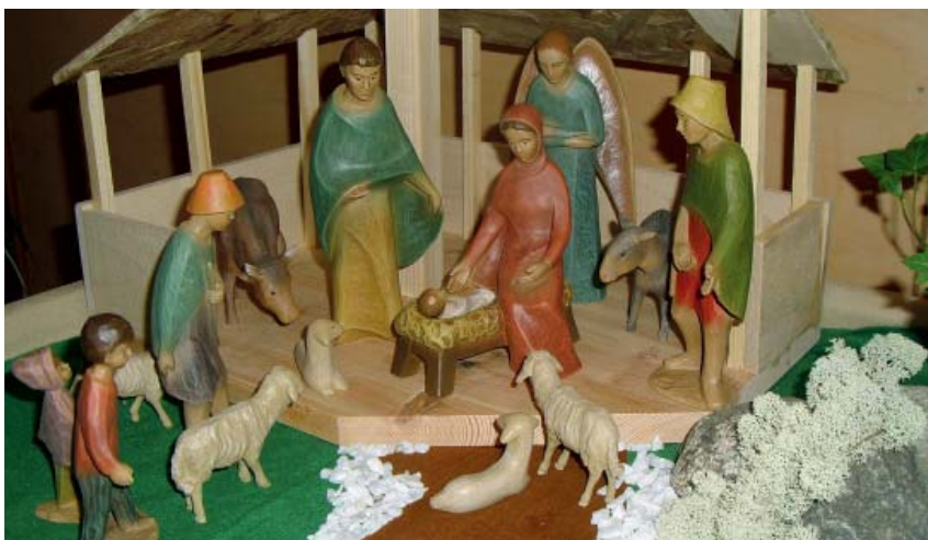
Medan de var i Betlehem, var tiden inne för Maria att föda, och hon födde sin son, den förstfödde. Hon lindade honom och lade honom i en krubba, eftersom det inte fanns plats för dem inne i härbärgat.