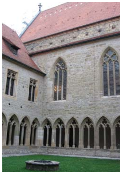
Augustinerklostret i Erfurt där Luther bodde sina första år som munk

Med det gav Luther med sig och promoverades som Doktor i Den Heliga Skrift år 1512. För att ha råd med promotionen fick han låna pengar av Wittenbergs kurfurste Fredrik den vise, universitetets skapare. Men då fick han lova att också verka som predikant i stadens församlingskyrka. Dessa två uppdrag, som