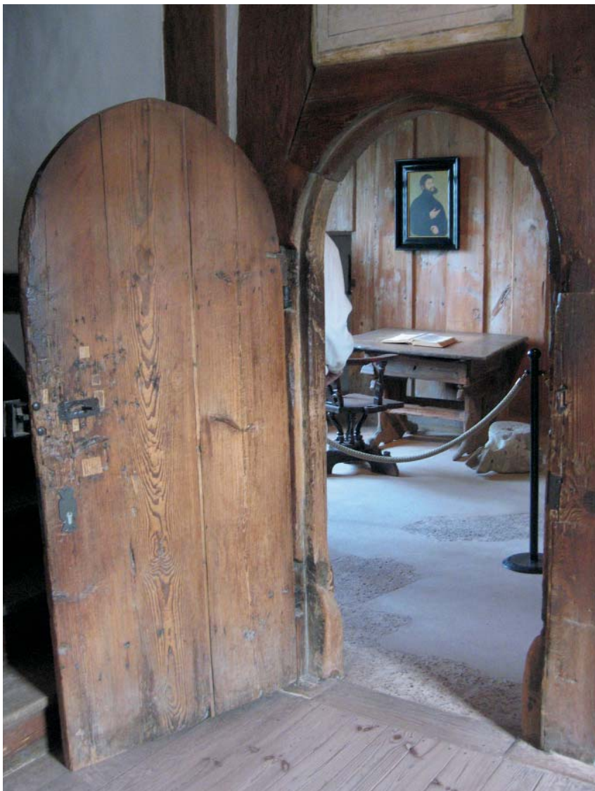
Rummet där Luther översatte Nya testamentet till tyska på borgen Wartburg.