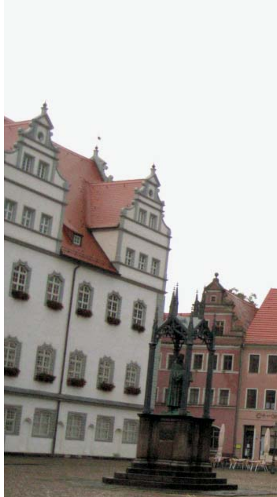
Torget i Wittenberg med Stadtkirche i bakgrunden där Martin Luther

"Min prior Staupitz satt en gång fundersam ... på vår gård. Till slut sa han: 'Herr magister, ni borde ta doktorsgraden, så ni fick någonting att göra'. ... jag satte mig till motvärn. Jag drog fram många skäl, framför allt att mina krafter var uttömda, att jag inte hade långt kvar att leva. Då sade Staupitz: 'Vet ni inte, att Vår Herre måste uträdda många stora ting? Till det behöver han många kloka och visa människor, som kan hjälpa till med att ge honom råd. När ni än dör, måste ni vara hans rådgivare.'"