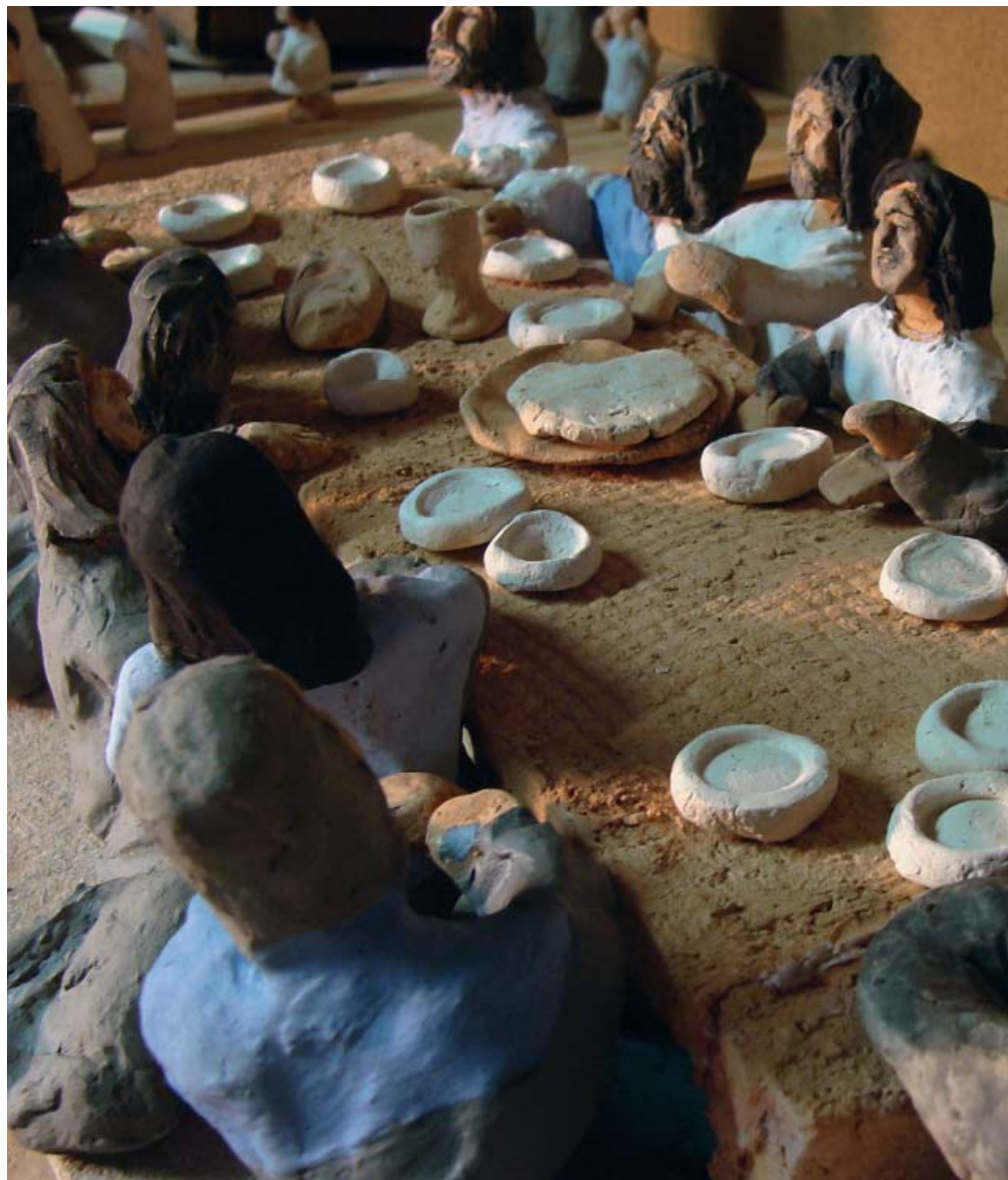
Den sista måltiden. Jesus ligger till bords med sina lärjungar.

Lärjungarna gick bort och gjorde så som Jesus hade sagt åt dem. De hämtade åsnan och fölet och lade sina mantlar på dem, och han satt upp. Många i folkmassan bredde ut sina mantlar på vägen,