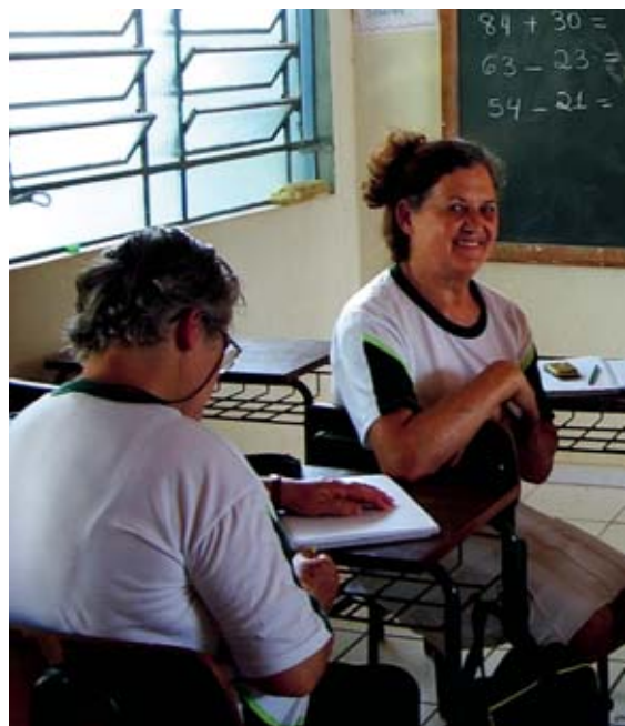
Vuxenutbildningen i Maringá på den brasilianska landsbygden.