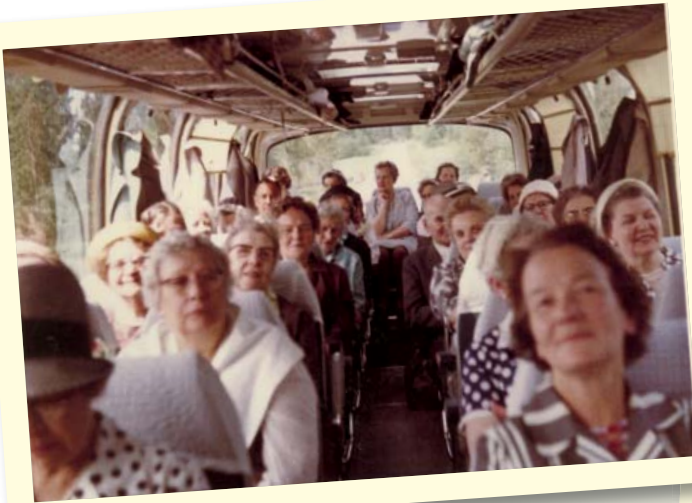
T.v. bussutflykt 1965, nedan utflykt till Stråssa turistgruva 1982.