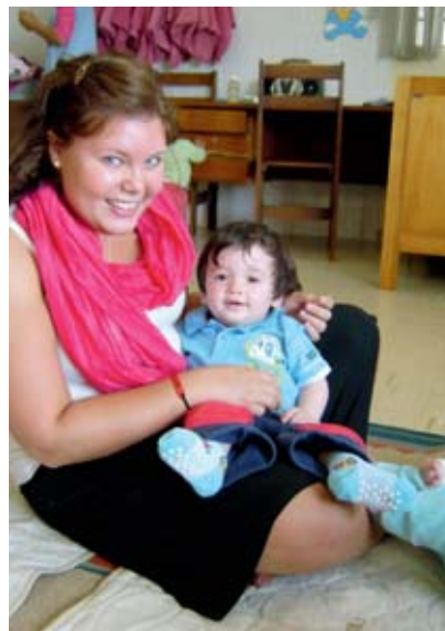
På barnhemmet i Curitiba.

Den 26 augusti satte vi fyra förväntansfulla stipendiater oss på planet mot Porto Alegre i södra Brasilien. Vi hamnade hos kyrkan IECLB, Igreja Evangelicá de Confissao Luterana no Brasil, och kulturkrockarna lät inte vänta på sig. Kyrkan visade sig ha ett starkt tyskt arv och istället för kyrkkaffe bjöds det på